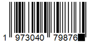
Grafik: F. Klinker

Die Ziffern der EAN-13 werden von vorne nach hinten durchnummeriert, wobei P die Prüfziffer bezeichnet: z_1 z_2 z_3 z_4 z_5 z_6 z_7 z_8 z_9 z_{10} z_{11} z_{12} P .